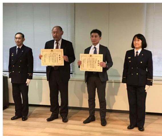
感謝状と授与式の模様