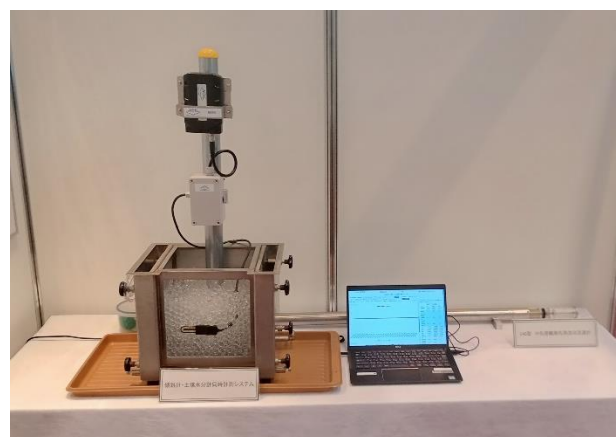
傾斜計・土壌水分計同時計測システム実機展示